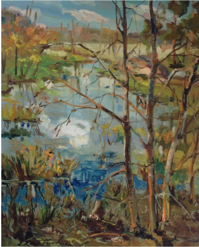
Kuva 4 Erik Rauthovin maalaus Elysee 1946.