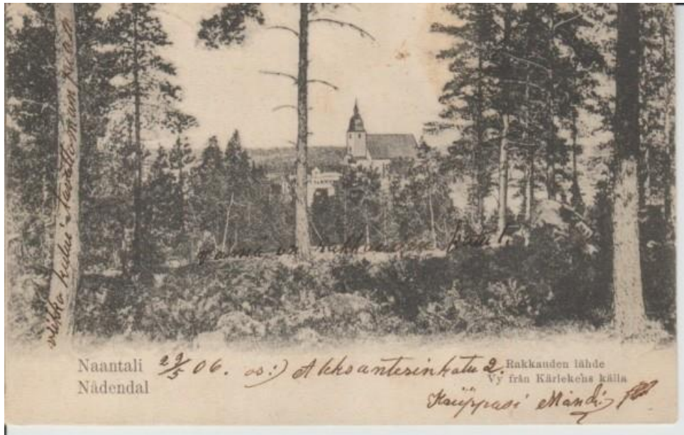
Kuva 8 Kortti Kultarannan Rakkauden lähteestä (kortti lähetetty 1906).