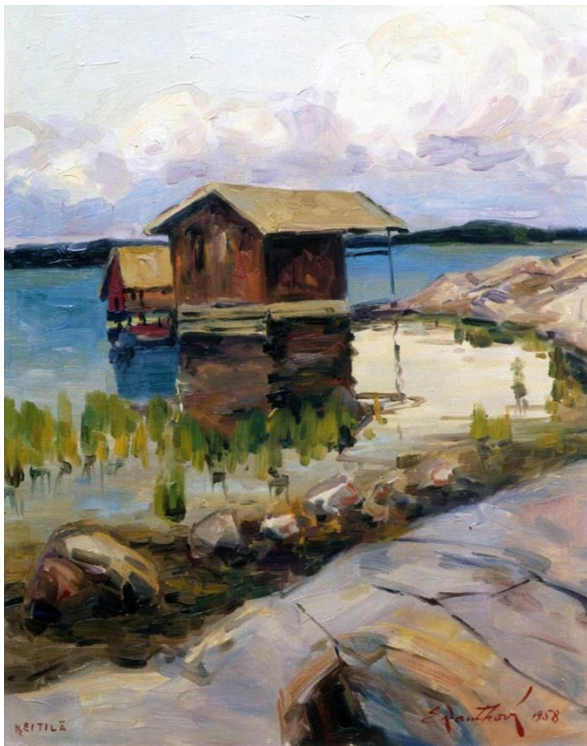
Kuva 5 Erik Rauthovin maalaus Keitilä 1958.