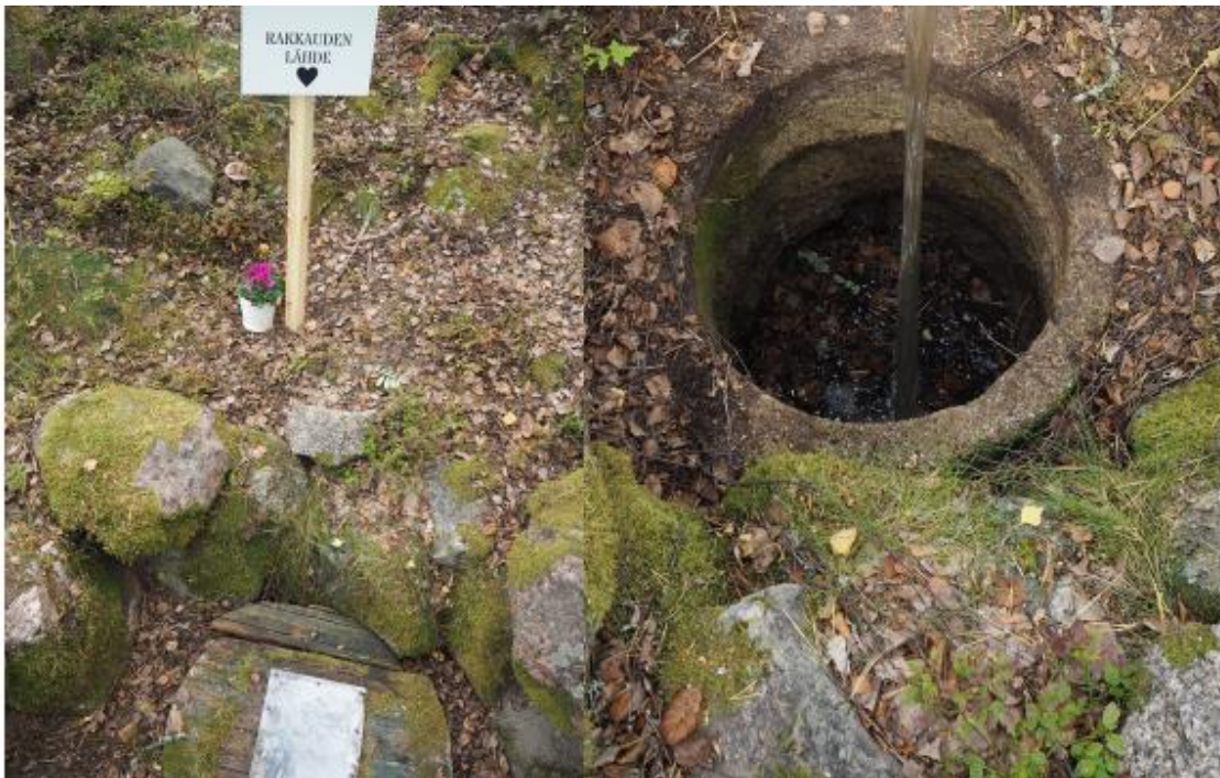
Kuva 1 Rakkauden lähde Kultarannassa runon esityspäivä 24.8.2018.

Asian selvittämistä motivoi myös se, että Naantalin Museoyhdistys ry elvytti Naantalin 575-vuotisjuhlaviikolla kylpylän historiaan liittyvien virkistysretkien perinteen järjestämällä 24.8. retken Rakkauden lähdeelle Kultarantaan. Tuossa tilaisuudessa runon alkupuoli esitettiinkin (ks. kuva 1).